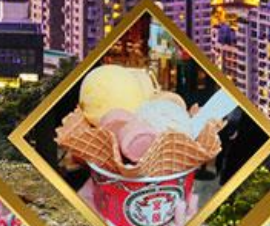
ลับสไอศครีม MIYAHARA