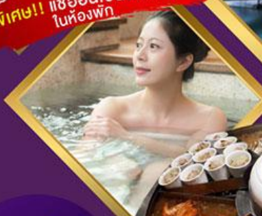
พิเศษ!! แช่ออนเซ็นส่วนตัว ในห้องพัก